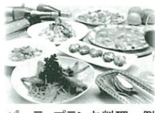
パーティプランお料理一例