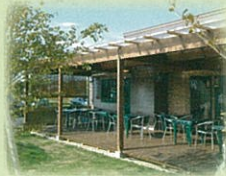
テラス席もございます(ペット可)