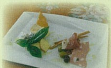
生ハムとチーズの盛り合せ