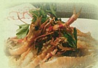
どっさり海老のトマトクリームパスタ